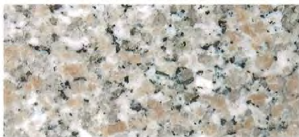
《ロータス テーブルピンク (TP) 》