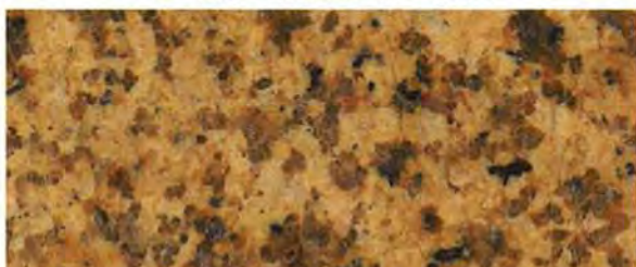
《ロータス ビッドイエロー (VY) 》