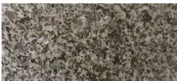
《ロータス カームグレー (CG) 》