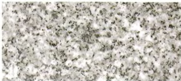
《ロータス カームホワイト (CW) 》