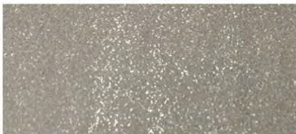
《ロータス グレーバサルト (GB) 》