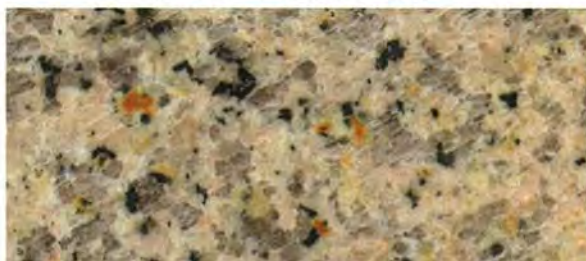
《ロータス ペールイエロー (PY) 》