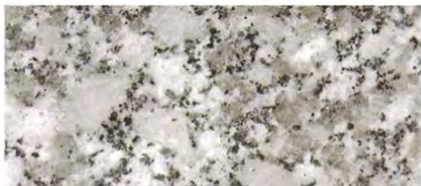
《ロータス スケールホワイト (SW) 》