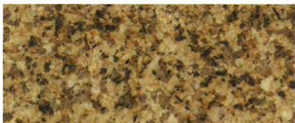
《ロータス クリアイエロー (CY) 》