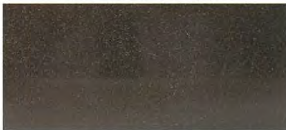
《ロータス ブラックバサルト (BB) 》