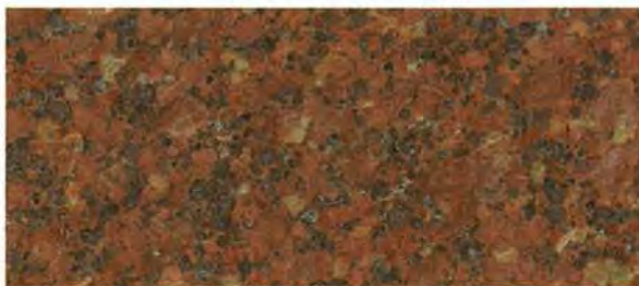
《ロータス ビッドレッド (VR) 》