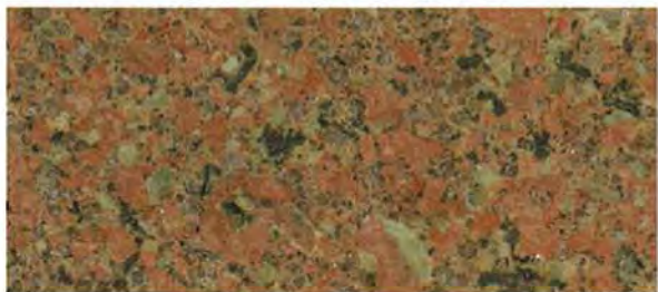
《ロータス ベールレッド (PR) 》